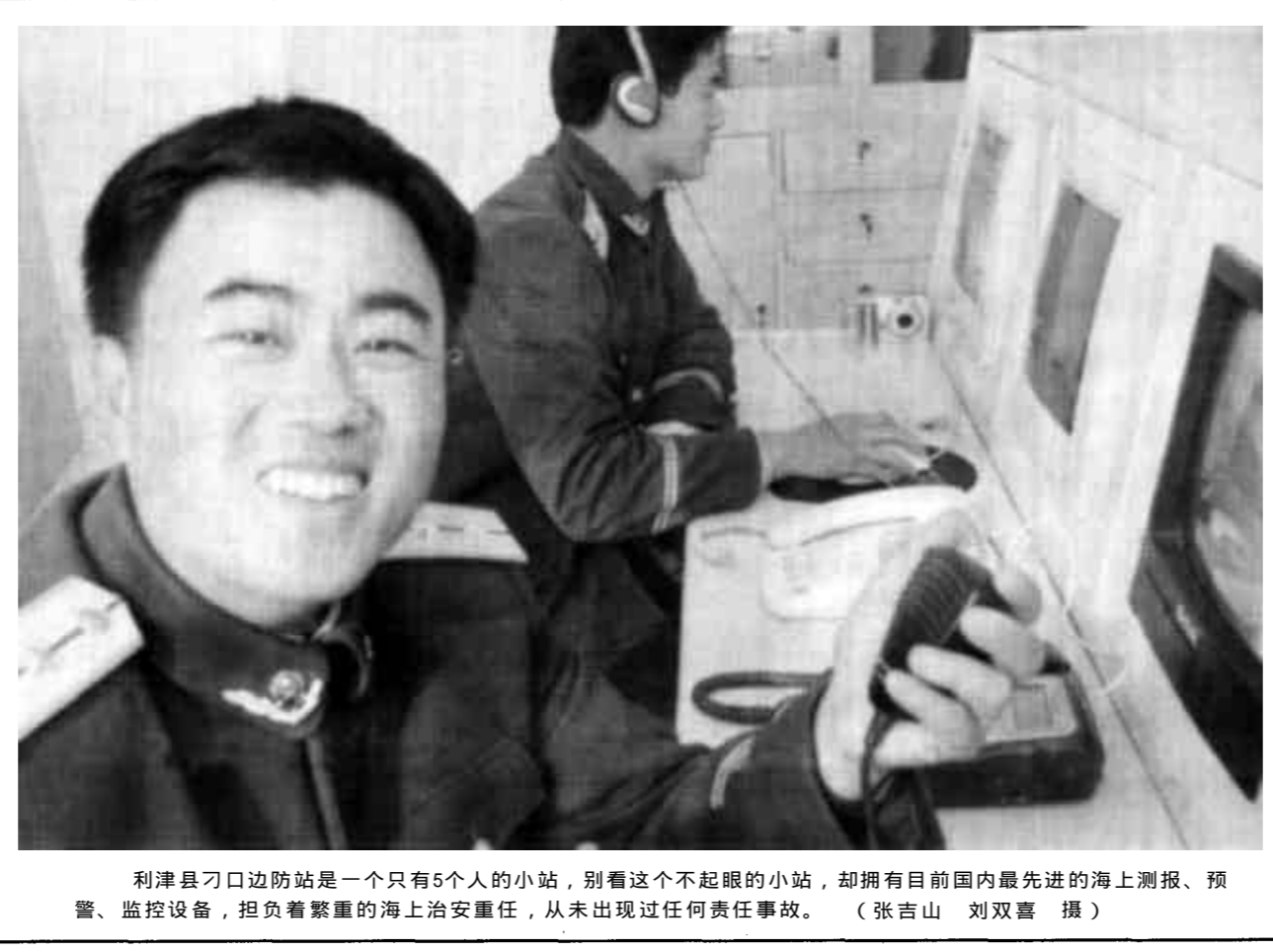
利津县刁口边防站是一个只有5个人的小站，别看这个不起眼的小站，却拥有目前国内最先进的海上测报、预警、监控设备，担负着繁重的海上治安重任，从未出现过任何责任事故。

利津讯 利津县为加快科技兴农步伐，立足县情，不断完善农村科技教育体系，加大对农民的农业科技教育力度，提高了农民科技文化素质，促进了农村经济发展。该县采取学历教育和非学历教育相结合、脱产学习与业余学习相结合、长班培训与短期培训相结合，联合办学，可农可牧，可工可医，因地制宜，按需施教，校校、校企优势互补。目前，全县农民中专学历毕业生达到1455名，大专毕业生352名，绿证教育结业学员3776人。其中157人晋升中级职称，650人被聘为农民技术员。