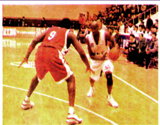
埃利斯马单挑“人猿泰山”